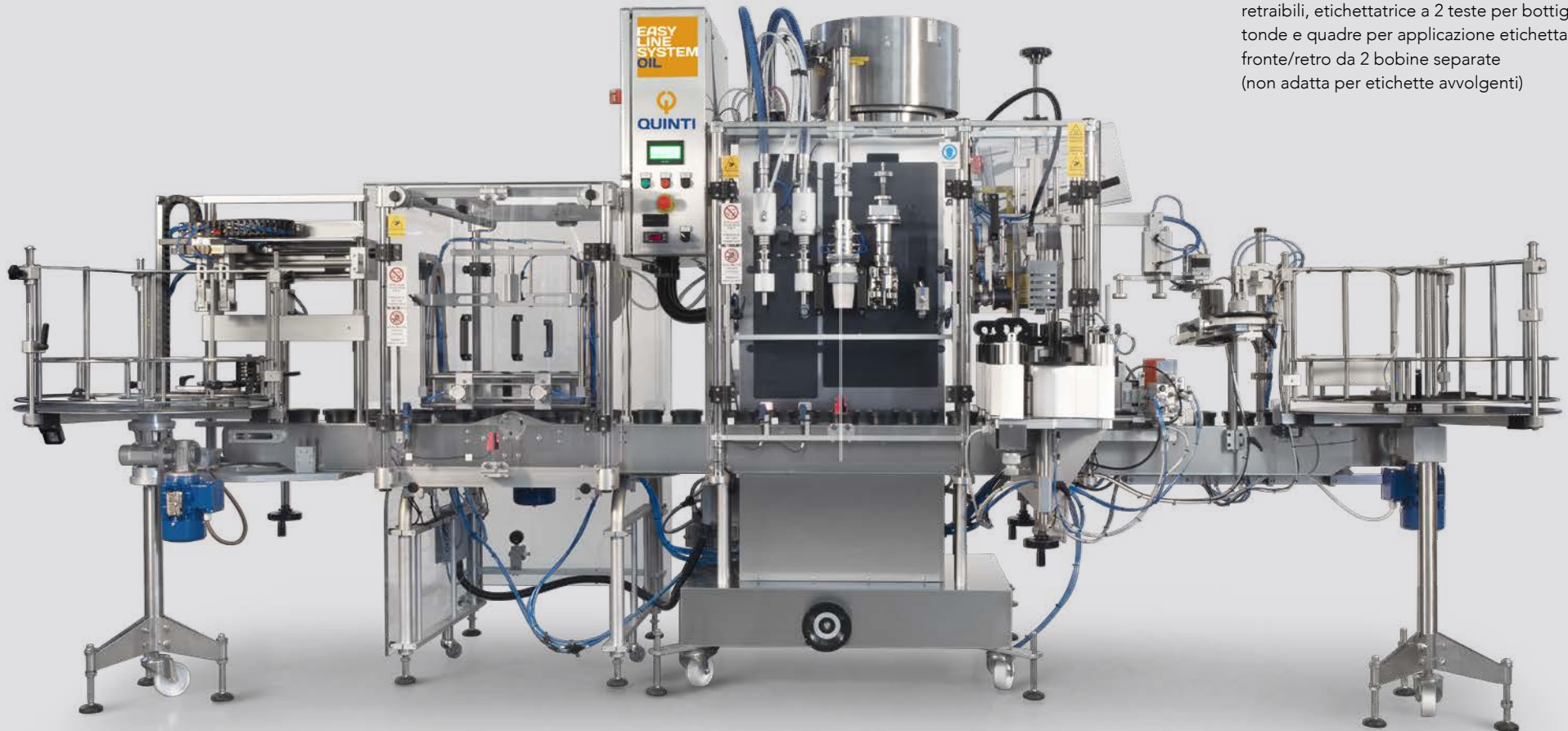
Immagine della linea in versione Premium con incapsulatrice per capsule termo-retraibili, etichettatrice a 2 teste per bottiglie tonde e quadre per applicazione etichetta fronte/retro da 2 bobine separate (non adatta per etichette avvolgenti)

La linea di imbottigliamento Easy Line System Oil 60 ET12 è disponibile in versione Base per rispondere alle principali esigenze di imbottigliamento in modo funzionale ed economico. La versione Premium comprende tutte le funzionalità aggiuntive capaci di rendere la linea altamente performante e versatile.