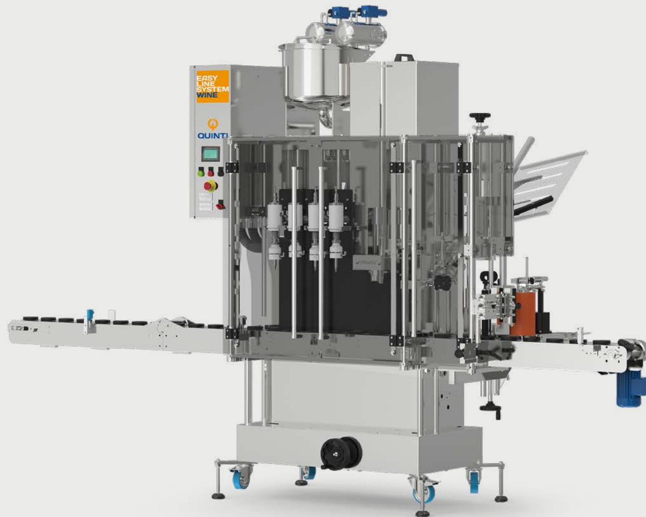
Immagine della linea con incapsulatrice per capsule termoretraibili, etichettatrice ad 1 testa (adatta per bottiglie cilindriche) per applicazione etichetta fronte/retro o una avvolgente da bobina unica.

La linea di imbottigliamento Easy Line System Wine 60 è disponibile in versione Base per rispondere alle principali esigenze di imbottigliamento in modo funzionale ed economico. La versione Premium comprende tutte le funzionalità aggiuntive capaci di rendere la linea altamente performante e versatile.